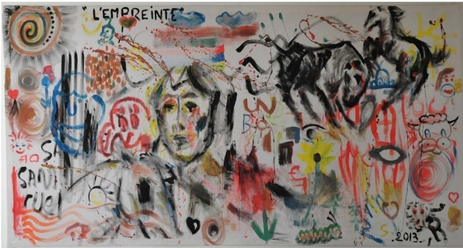
Tableau réalisé par les participants lors de l'inauguration du FAM "Le Patio" de Saint-Dié des Vosges